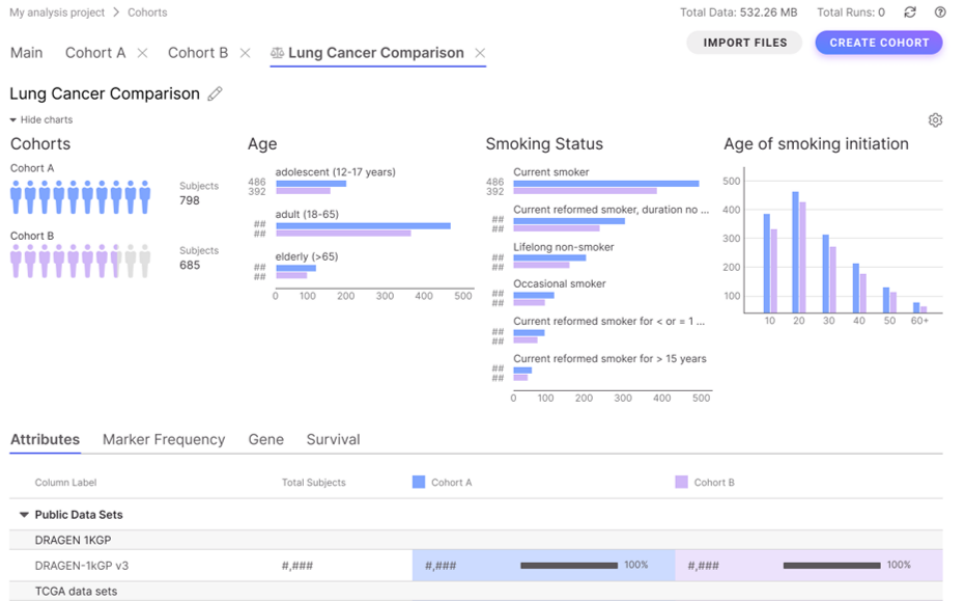
그림 3: Illumina Connected Analytics Cohorts — Illumina Connected Analytics에서 애드온 모듈을 통한 분자/유전체 데이터의 신속한 빌드 및 탐구 지원